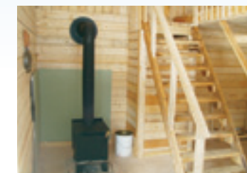
INTÉRIEUR DES REFUGES