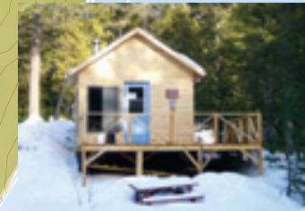
REFUGE DU GARDIEN

Quatre refuges sont disponibles pour revivre la vie des travailleurs forestiers. Le poêle à bois et la mezzanine, où vous pouvez installer votre lit de camp, vous transportent à une autre époque. Le refuge de l'accueil (6 places), le refuge du gardien (4 places), le refuge des draveurs (4 places) et le refuge du belvédère (6 places) sont à votre disposition pour agrémenter votre séjour. Réservation obligatoire : 450 883-2730. Nuitée : 20 $/personne