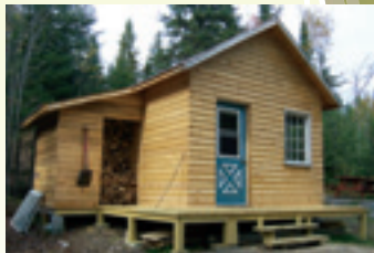
REFUGE DES DRAVEURS