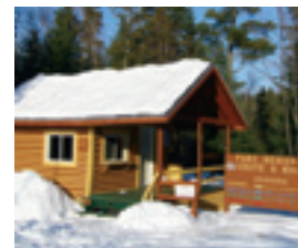
REFUGE DE L'ACCUEIL

Suivre les indications par le rang des Venne qui se prend de la route 347 ou par le chemin de la Ferme.